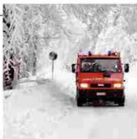
Borgetto e Giubilei A PAGINA 12

MALTEMPO La neve lascia disagi e polemiche