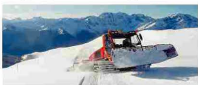
Battipista in azione per il fine settimana dedicato allo sci

L’Arpa lancia però l’allarme valanghe: «Il passaggio su pendii anche poco ripidi potrebbe provocare il distacco di lastroni». Un allarme confermato anche dalla Forestale. Tanta neve, insomma, ma non per gli amanti del