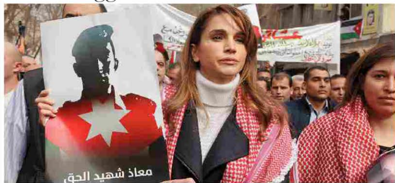
La regina Rania, a una manifestazione contro l'Isis, mostra la foto del pilota ucciso dagli islamisti Mastrolli, Molinari e Semprini ALLE PAG. 4 E 5